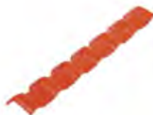
TF 105 - Faldón