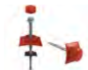
TP-UT - Set de fijación