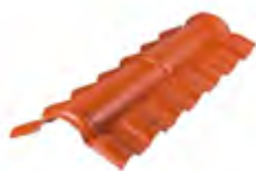
TCU 105 - Cumbreira principal