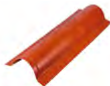
TD 210 - Cumbreira diagonal