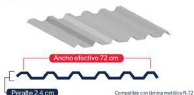
Lámina T-8 (R-72)*