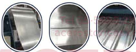
Lámina de acero recubierta con una capa de zinc que proporciona protección contra la corrosión, este proceso se conoce como galvanización y se realiza sumergiendo la lámina en un baño de zinc. La capa de zinc actúa como una barrera protectora, impidiendo que el acero entre en contacto directo con el oxígeno y la humedad del entorno, lo que evita la formación de óxido.